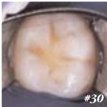
Restaurations minimalement invasives

• L'injection rapide de matériaux à faible viscosité, à l'intérieur de petites cavités, peut causer la formation de porosités, lesquelles altèrent les propriétés de la restauration et produisent des imperfections en surface qui apparaissent avec l'usure.