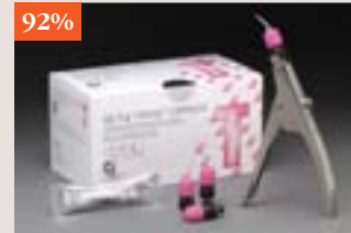
GC Fuji TRIAGE (GC America)